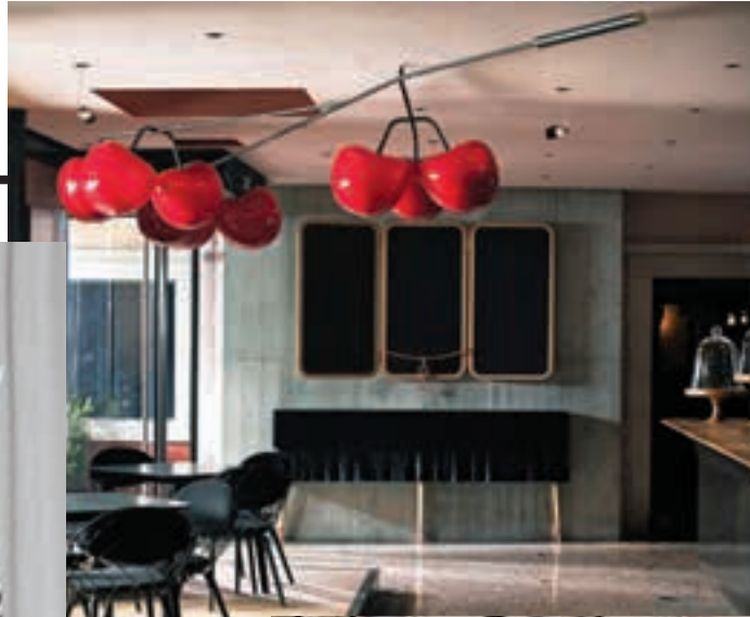
De arriba hacia abajo Entrada del restaurante Aperitivo, en Eslovenia. Café Lolita en Eslovenia. Arquitectura de Trije Arhitekti e interiores de Nika Zupanc. Restaurante Aperitivo.