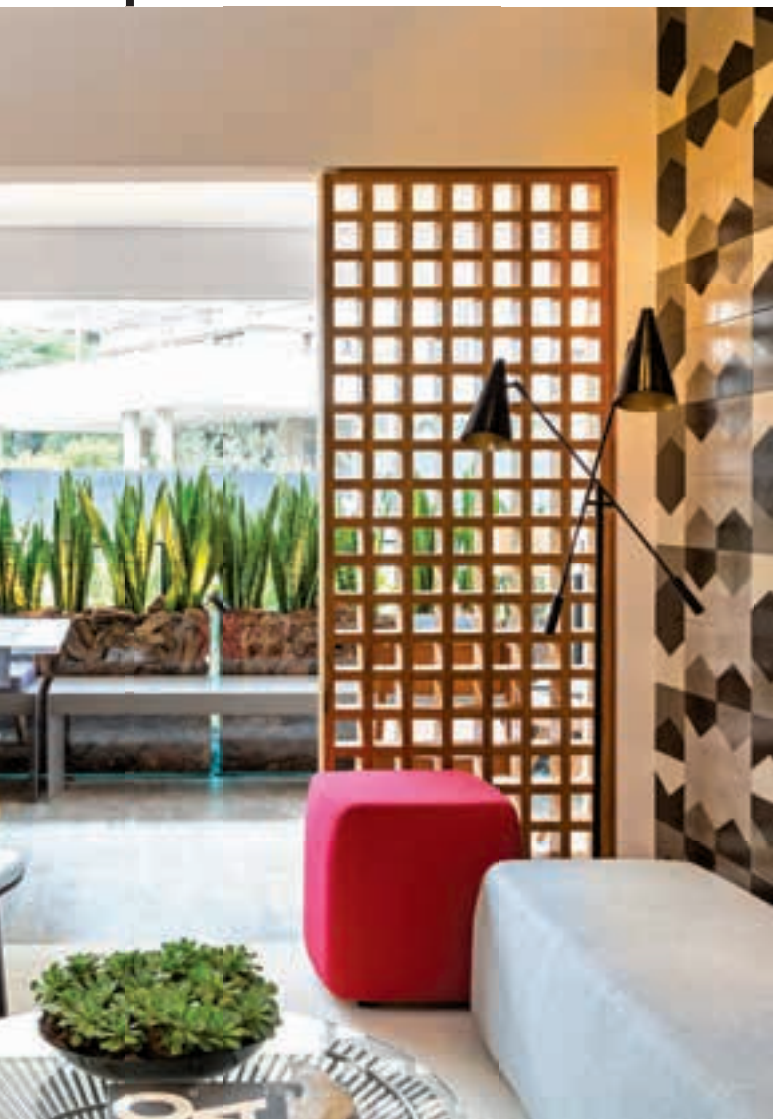
De izquierda a derecha Departamento en São Paulo. Restaurante Bossa en Brasil.