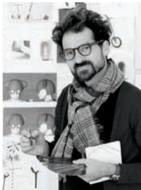
De arriba hacia abajo Boutique de Camper en Tokio. La Terraza del Casino en Madrid.