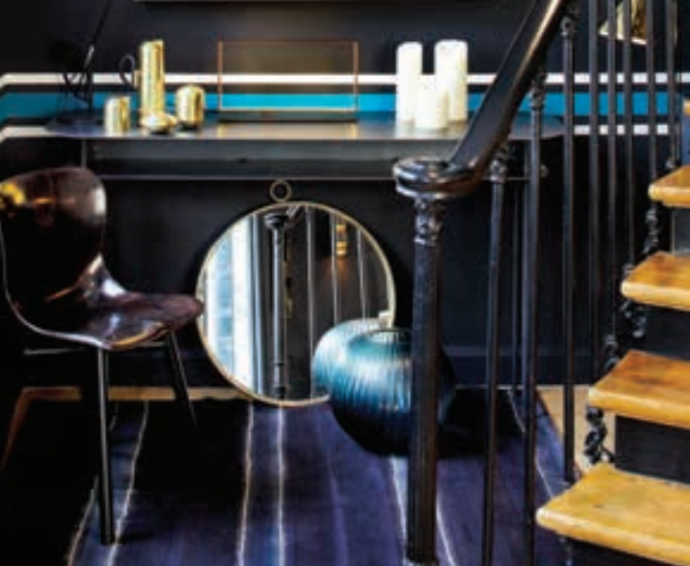
Izquierda y derecha Boutique Rue du Bac de Sarah Lavoine, París.