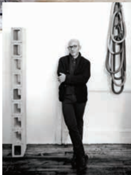
Greenwich Village Apartment en Nueva York.