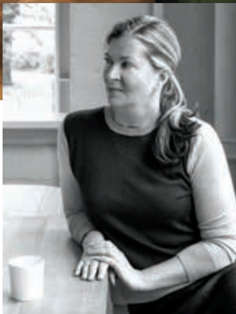
Hotel Ett Hem en Estocolmo, Suecia.